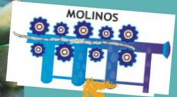
molino ó "trapiche"